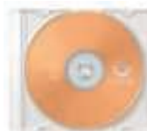
データログ管理プログラム 部品番号: 9811 0930 30