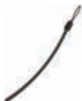
ハンドストラップ 部品番号: 0888 0605 90