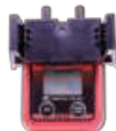
校正キャップを取り付けたイメージ