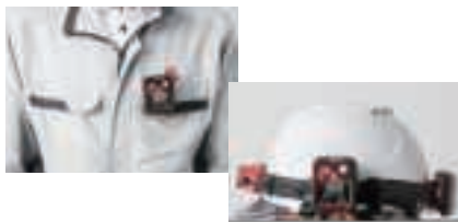
ヘルメット上のバンドに装着したイメージ