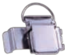
アリゲータークリップ 部品番号: 4711 7111 10