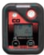
プロテクトカバー: 1個 部品番号: 4123 6450 20