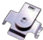
ヘルメット用クリップ*2 部品番号: 4732 4978 10