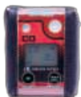
耐熱ケース*1 部品番号: 4732 5029 70