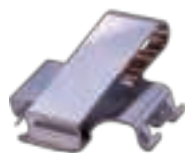
ベルトクリップ: 1個 部品番号: 4123 6463 30