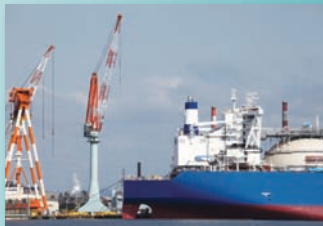
船舶、オフショア設備