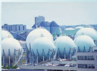
石油精製工場/ 石油化学基礎製品工場