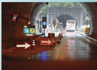
共同溝、洞道、工事現場